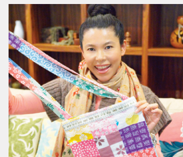
▲とても余り物の生地で作ったとは思えない自作のエコバッグ。

リメイクグッズでお出掛けするとルンルン気分になれるという。こんなに素敵なデザインなら当然ですね！