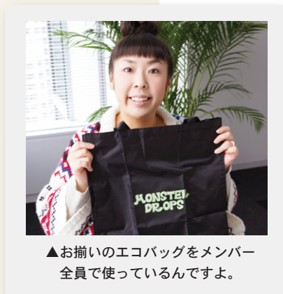
▲お揃いのエコバッグをメンバー全員で使っているんですよ。

部屋のなかでもちょっと肌寒いと感じるときは暖房をつけるのではなく、まずは1枚上着を羽織るのがくせなのだとか。